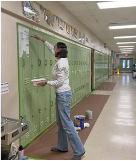
How it started...