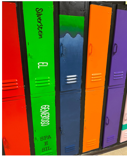
Como ha progresado...